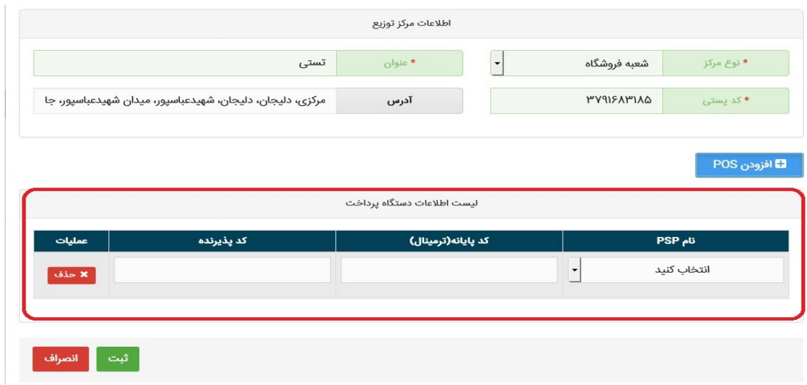
شکل ۴- محل وارد کردن اطلاعات دستگاه پرداخت

۴) تکمیل اطلاعات POS برای عاملین توزیع کالاهای اساسی (برنج، روغن، گوشت، چای، شکر و ...) الزامی می باشد. با کلیک بروی دکمه افزودن POS، سامانه از کاربر می خواهد که اطلاعات مربوط به POS مرکز توزیع را وارد نماید و در انتها بروی دکمه ثبت کلیک نماید.