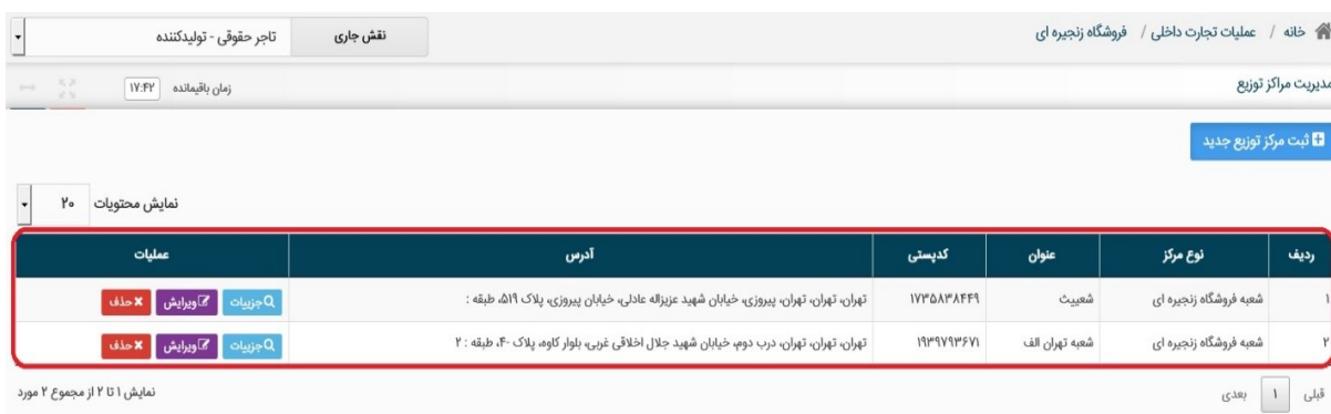
شکل ۵- فرم مدیریت مراکز توزیع

۵) پس از ثبت موفق مرکز اطلاعات ثبت شده مرکز در صفحه مدیریت مرکز توزیع قابل مشاهده است. پس از ثبت مرکز توزیع امکان ویرایش یا حذف آن در قسمت عملیات قابل انجام است.