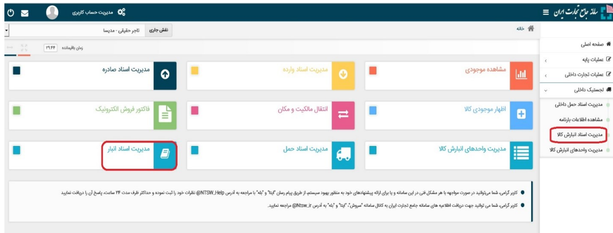
شکل ۷- دسترسی به منوی مدیریت اسناد انبار

۱) با استفاده از منوی "مدیریت اسناد انبارش کالا" از منوی "لجستیک داخلی" و همچنین دکمه مدیریت اسناد انبار در صفحه اصلی، می‌توانید اسناد (رسید / حواله) ثبت شده در سامانه جامع انبارها را مشاهده نمایید (شکل ۷)